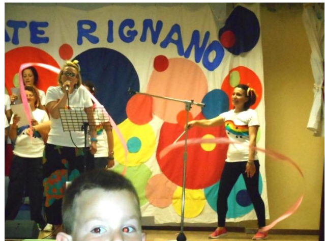
Avevano i capelli legati con i fiocchi,